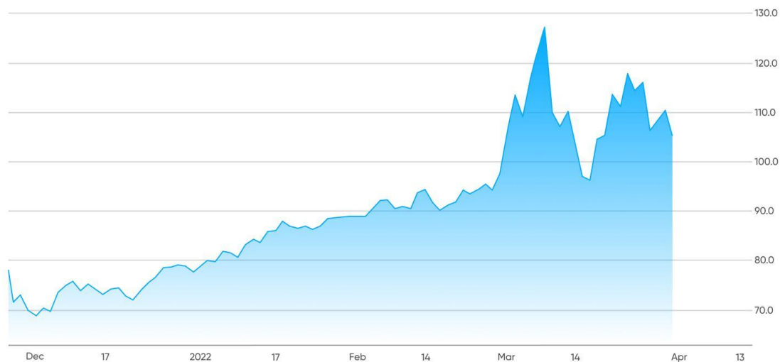
Brent crude oil price chart

Comme illustré ci-dessus, les prix du pétrole ont connu une forte volatilité et des hausses marquées, en raison de l'intensification des tensions géopolitiques au Moyen-Orient, en particulier celles liées à l'Iran et au détroit d'Ormuz, un point stratégique essentiel qui représente environ 20 % à 27 % de l'approvisionnement mondial en pétrole.